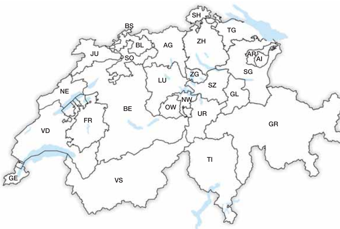
Die Schweiz und ihre 23 Kantone

Den Umfang der Gemeindeautonomie bestimmen die einzelnen Kantone – er ist deshalb recht unterschiedlich.